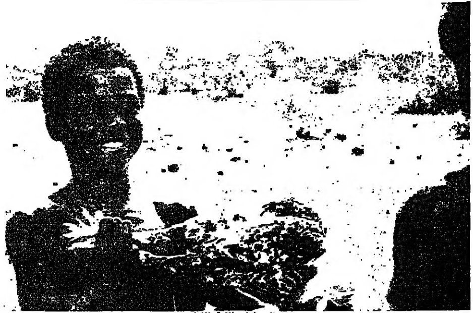
السينما ونظرة الأولاد